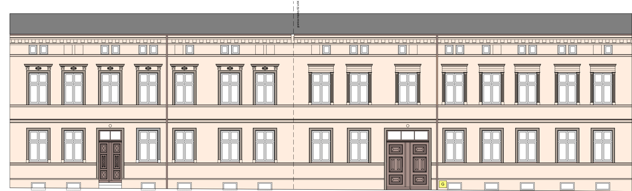
FASADA FRONTOWA- WSCHODNIA

PRZED PRZYSTĄPIENIEM DO REALIZACJI INWESTYCJI LUB JEJ CZĘŚCI, WSZYSTKIE WYMIARY NALEŻY SPRAWDZIĆ NA PLACU BUDOWY. WSZYSTKIE UŻYTE DO PRZEDMIOTOWEJ WYKONCZENIA I MATERIAŁY POWINNY POSIADAĆ ODPWIEDNIE ATETY I ŚWIADECTWA DOPUSZCZENIA ZGODNIE Z POLSKIMI NORMAMI ZEZWALAJĄCE NA STOSOWANIE W BUDOWNICTWIE NA TERENIE POLSKI.